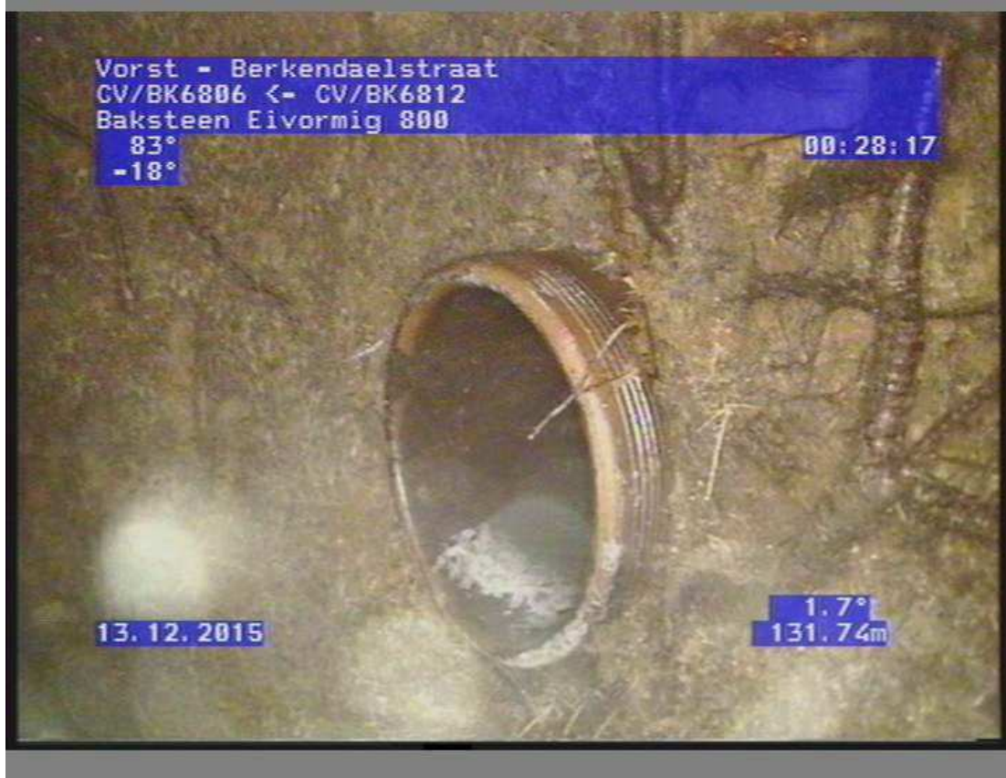
Présence de racines dans l'égout principal, mettent en péril sa structure même.