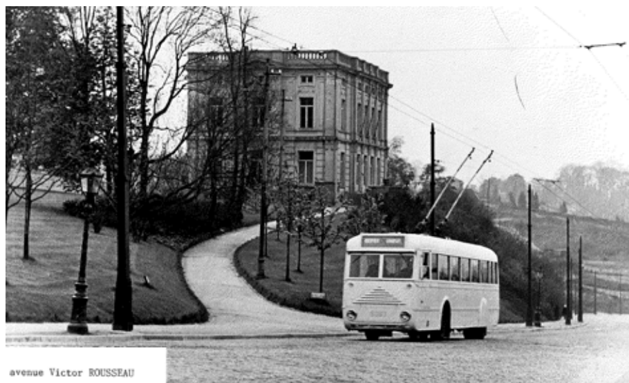
avenue Victor ROUSSEAU

Tijdens de tentoonstelling 2011 van de Geschiedenis- en Patrimoniumkring van Vorst waarin ondermeer het relaas gedaan werd van de geschiedenis van het vervoer in Vorst, stond de oude trolleybus 54 bijzonder in de belangstelling.