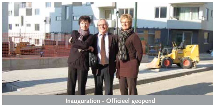
Inauguration - Officieel geopend

Adresgegevens van het Paramedisch Verzorgingscentrum Bervoets Marguerite Bervoetsstraat, 117 1190 Brussel GSM: 0479 30 56 08